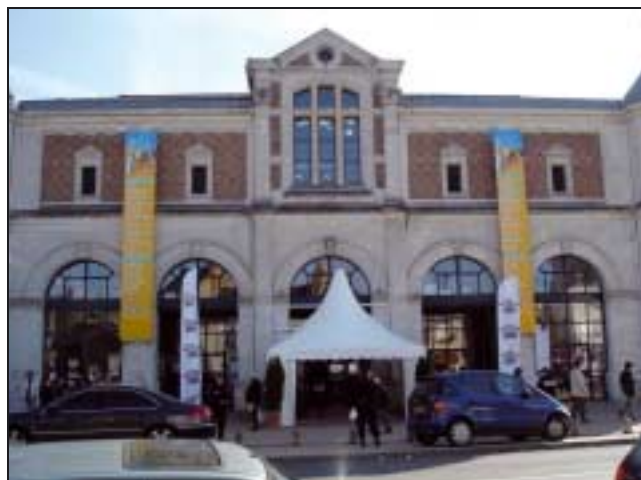
Vue de l'entrée principale des « Rendez-vous de l'Histoire ».