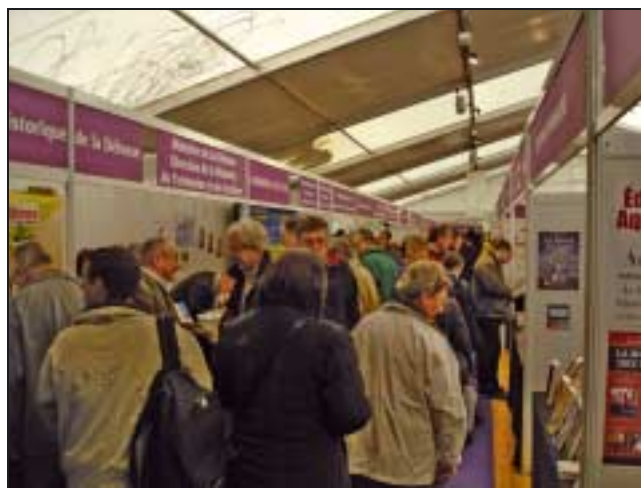
L'allée du stand de la Fondation à l'heure de pointe.