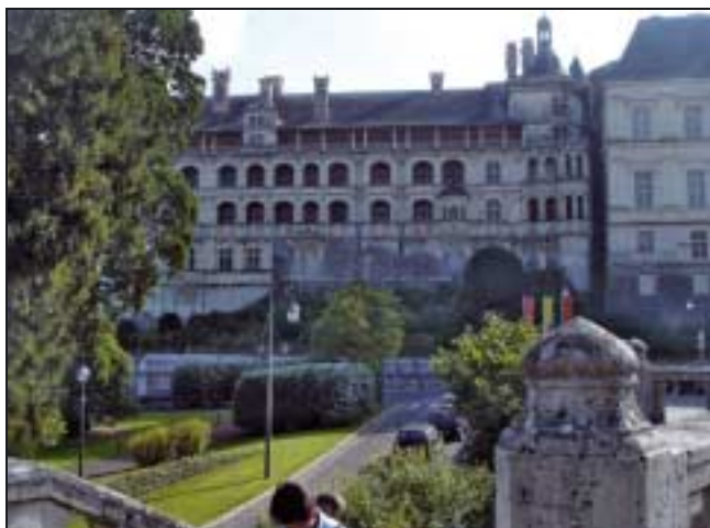
Château de Blois.

Coiffant l'ensemble de la manifestation, un thème général est par ailleurs proposé chaque année, autour duquel s'organisent différentes tables rondes et conférences débats. Pour 2007, le thème retenu était « L'opinion: information, rumeur, propagande ». Une série ininterrompue d'exposés et de conférences-débats, tout aussi intéressants les uns que les autres, au point qu'il est difficile de faire un choix, pourtant inéluctable, ponctuent les trois jours de ces rencontres. Un plaisir de l'esprit, dans un cadre magnifique et... historique.