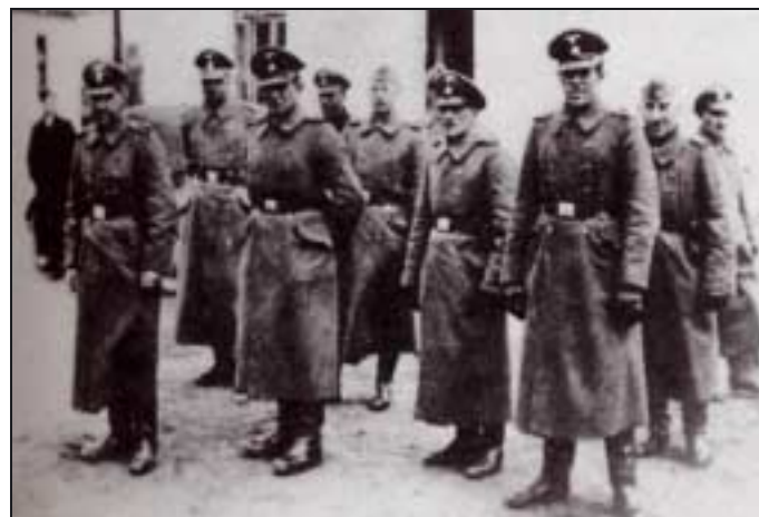
Equipe de garde à Belzec.

Le camp est classé « zone secrète » et son accès rigoureusement interdit. A l'arrivée des trains les chemins sont relevés par une équipe spéciale. L'aspect général