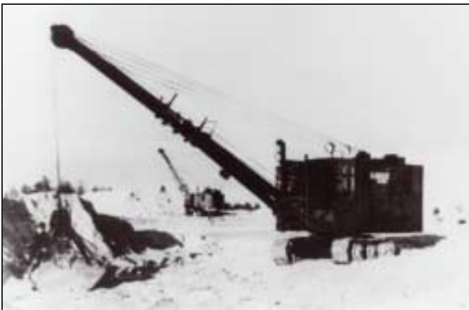
Treblinka effacement des traces.

La révolte déclenchée le 2 août 1943, précède celle de Sobibor. Le camp compte environ 700 détenus employés aux opérations spéciales et à divers travaux d'entretien. Avec le début de l'effacement des traces, l'inquiétude des détenus sur leur liquidation prochaine grandit. L'un d'eux, serrurier parvient à faire un double de la clé de l'armurerie. Mettant à profit un jour de grande chaleur où la garde est réduite, les détenus s'emparent de grenades, de fusils et revolvers. La révolte éclate vers 16 heures, sous forme de fusillades et incendies d'une partie des bâtiments. 150 à 200 détenus parviennent à s'enfuir du camp. Une soixantaine échapperont aux poursuites. Ces événements ont pour conséquences de hâter la liquidation du camp. Les deux derniers convois arrivent de Bialystok les 18 et 19 août 1943, puis le camp est démonté et les traces effacées 1 . Le nombre de victimes de l'opération Reinhard à Treblinka est estimé à quelque 800 000.