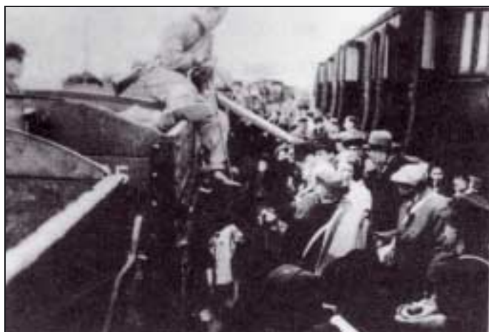
Arrivée d'un convoi à Sobibor.

Une première vague couvre les mois de mai, juin et juillet 1942. Elle concerne les Juifs de la région de Lublin