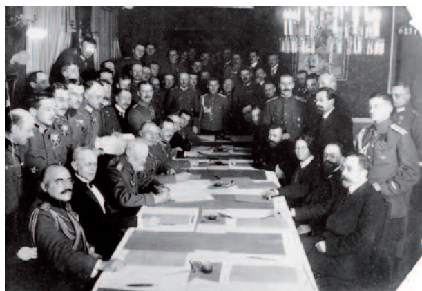
Armistice de Brest-Litovsk

Le nationalisme agressif des pangermanistes et les rêves entretenus par la propagande colonialiste avaient suscité des attentes qui, avec la désillusion de la défaite, allaient se radicaliser. Sur le plan intérieur les positions de l'extrême droite se renforçaient. En 1917-1918 le « parti de la patrie allemande » avait mobilisé près d'un million de personnes (selon ses dires) contre la politique de la paix de compromis prônée par la majorité du Reichstag (SPD, Centre et Libéraux de gauche). Son influence culmina durant la période comprise entre le traité de Brest-Litovsk (3 mars 1918) avec la Russie soviétique et les offensives du printemps 1918 qui allaient raviver une dernière fois l'espérance d'une victoire. Mais une fois la défaite consommée, ce parti se disloqua, sans que les motivations qui l'avaient animé disparaissent. L'effondrement rapide de l'empire, en novembre 1918, allait conduire les sociaux-démocrates à sous-estimer le potentiel de la menace réactionnaire : ce fut leur plus grande erreur.