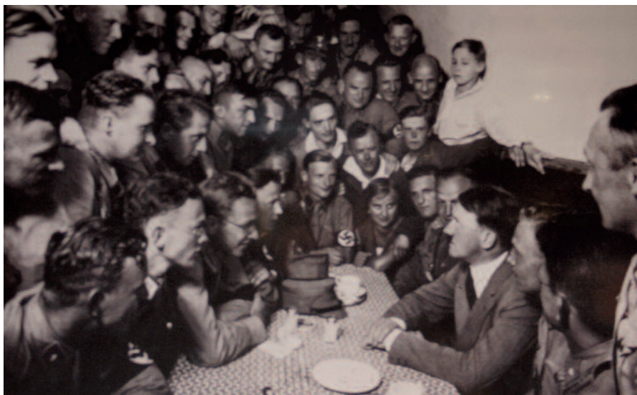
Hitler s'entretenant avec de jeunes SA à Munich

De part et d'autre, le sentiment d'impasse se traduisait par l'emploi démonstratif de la force. Dans ces milieux radicalisés de jeunes étudiants et ouvriers, là où en particulier le mouvement socialiste demeurait faible, la SA de Hitler et Röhm allait trouver des adeptes et proposer de nouveaux cadres de vie, collectifs, encadrés et protecteurs.