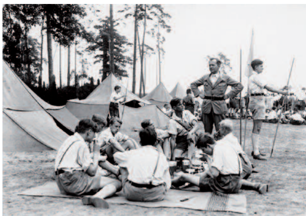
Camp de Bündischen Jugend à Berlin (Grünewald 1933)