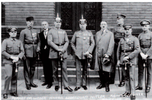
Hitler et Ludendorff lors du putsch manqué de Munich (les 8 et 9 novembre 1923)

Entre la droite établie et la mouvance révolutionnaire nationaliste émergea le parti ouvrier allemand national socialiste (NSDAP) d'Adolf Hitler, qui commença à recruter des adeptes, y compris hors de Bavière, berceau du mouvement.