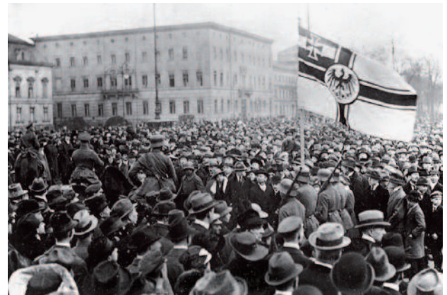
Entrée à Berlin du général Kapp à la tête de sa brigade de Corps Francs Marinebrigade Erhardt

poignard dans le dos », selon lequel des politiciens (en l'occurrence les Sociaux-démocrates, les Libéraux et le Centre catholique), complices du mouvement des Conseils, auraient « frappé dans le dos l'armée invaincue » 1 .