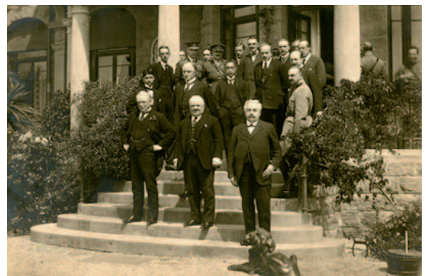
La Conférence de Gênes 1922. Le premier Ministre britannique Lloyd George au premier rang à gauche.

La conférence de Gênes sur l'économie mondiale, organisée en avril-mai 1922 à l'initiative du Royaume-Uni, se proposait de rétablir l'ordre monétaire complètement désorganisé par la Première Guerre mondiale et la Révolution russe, et de définir une politique commune de l'ouest vis-à-vis de la Russie soviétique. Elle réunit tous les pays ayant participé au conflit, sauf les États-Unis, mais se solda par un semi-échec, les Alliés refusant le principe d'une coopération pleine et entière avec l'Allemagne. La conséquence indirecte en fut l'accord de Rapallo, ville voisine de Gênes, où Allemagne et Russie conclurent un traité séparé, prévoyant leur renoncement aux dommages de guerre, un règlement bilatéral des questions économiques et diplomatiques, et un important volet secret de coopération militaire. Cet accord fut diversement apprécié. Pour les pays occidentaux, il concrétisait la formation d'un « axe révisionniste » germano-soviétique. Pour le Reich et son ministre des affaires étrangères Walter Rathenau, il devait constituer un atout dans le jeu alterné de coopération et de confrontation à l'égard des puissances occidentales. À court terme, il n'allait ni apporter le succès escompté (sauf en matière de coopération militaire clandestine), ni inciter les Occidentaux à plus de clémence avec l'Allemagne. Le Reich venait de compromettre toute possibilité de « front uni » contre la Russie soviétique sur les plans