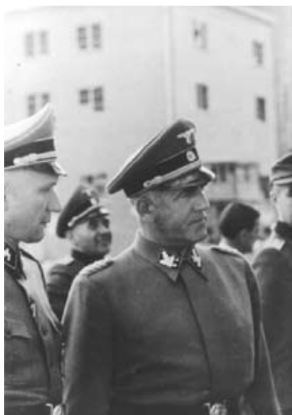
> Oswald Pohl, chef du WVHA en visite officielle à Auschwitz, accompagné par Richard Baer, commandant du camp.

Le nombre de victimes tziganes exterminées se situe entre 200 000 et 500 000.