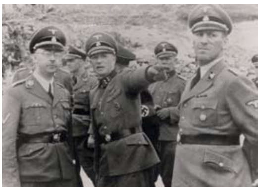
> De g. à d.: Heinrich Himmler, Ziereis (commandant du camp) et Kaltenbrunner chef du RSHA au camp de Mauthausen.

Le régime national-socialiste a conçu et mis au point un système de camps de concentration apparu dès l'accession de Hitler au pouvoir, en 1933, et qui n'a cessé de se développer jusqu'à la défaite de l'Allemagne.