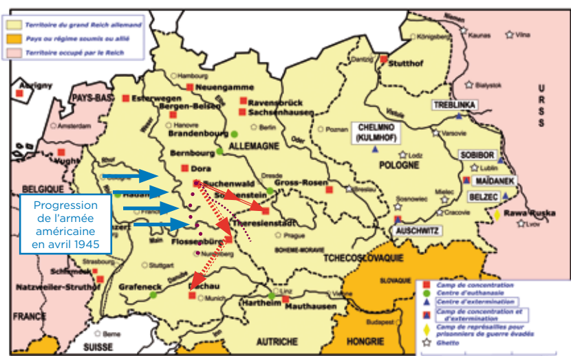
> Évacuation de Buchenwald. ———→ par train ..... marches

Les évacuations s'échelonnèrent jusqu'au 10 avril 1945. Elles ont concerné environ 28 000 détenus. Face à la résistance passive et au désordre entretenu par le comité clandestin pour retarder les évacuations, les SS se livrèrent à de véritables rafles dans le camp. Des colonnes d'évacuation partaient quotidiennement vers le sud et vers les Sudètes. Le dernier convoi de 9 280 détenus fut mis en route le 10 avril 1945, la veille de la libération.