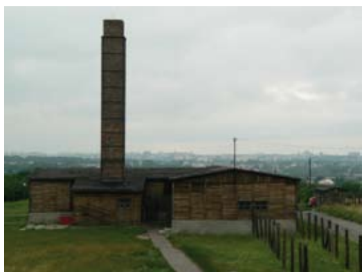
> Maidanek, le crématoire. En arrière plan, l'agglomération de Lublin.

> Principaux transferts depuis le camp de Maidanek en 1944.