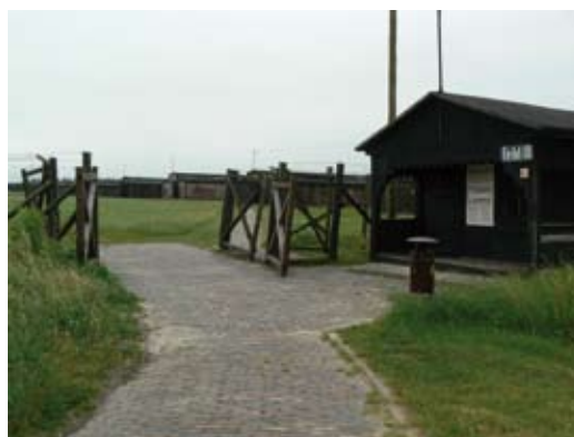
> Lublin-Maidanek, entrée du camp donnant sur le champ 3.