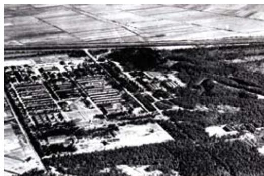
> Vue aérienne du camp de Vught en 1947.

- le camp de concentration et de transit de Herzogenbusch (Vught dans les Pays Bas), situé près de la frontière belge, d'où près de 12 000 Juifs avaient été envoyés et exterminés à Auschwitz et Sobibor. Il fut évacué en septembre 1944, les femmes vers Ravensbrück, les hommes vers Sachsenhausen et saisi par l'armée canadienne qui n'y trouva plus qu'une centaine de détenus malades, les 26 et 27 octobre 1944.