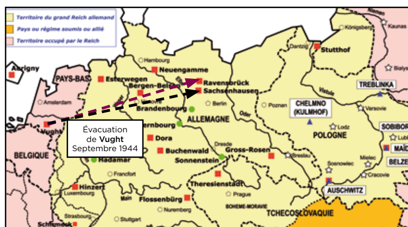
> Le camp de Vught (Herzogenbusch) est évacué vers Ravensbrück et Sachsenhausen en septembre 1944.